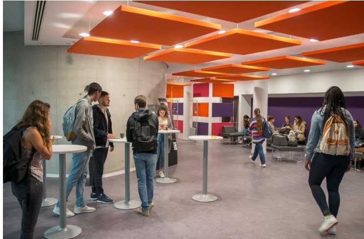
Le hall d'entrée

❤️ C'est pour vous un lieu de convivialité central et bien pensé, qui répond à vos attentes et à vos besoins.