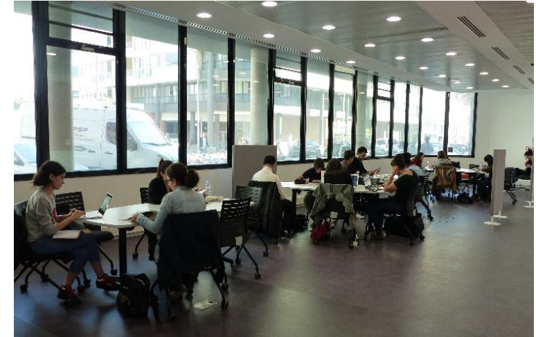
L'espace de travail au RDC

⚙️ Vous aimeriez que cet espace soit plus calme et offre plus de places assises.