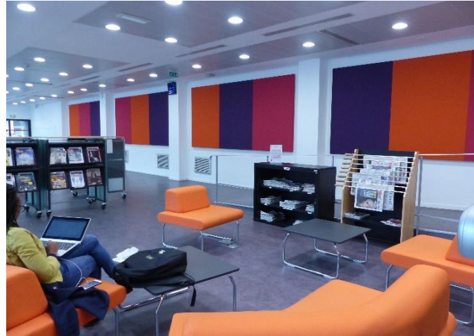
L'espace Presse et BD

⚙️ Vous souhaiteriez moins de bruit et de courants d'air, plus de machines à café, et des toilettes plus nombreuses!